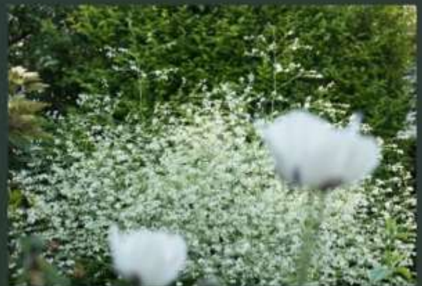
papaver 'perry's white' en crambe cordefolia