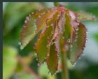
rosa Miriandell geranium renardii