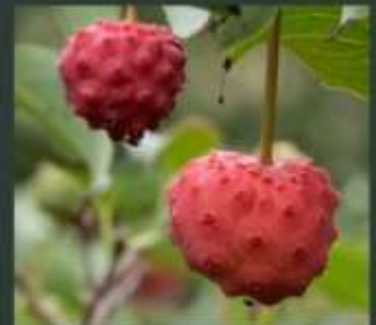
coronus kousa kousa phlomis russeliana