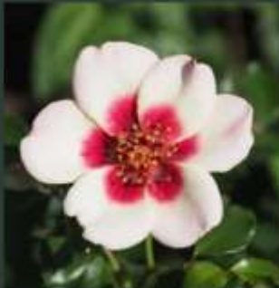
rosa Sweet Babylon Eyes' thalictrum a. 'album'