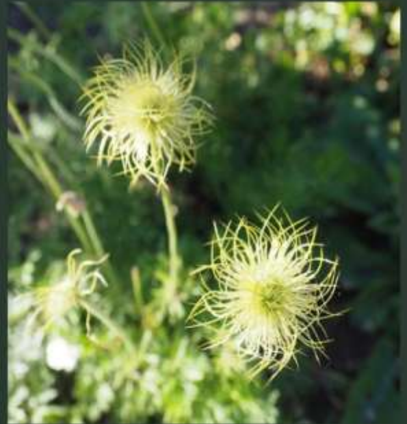
2 x pulsatilla