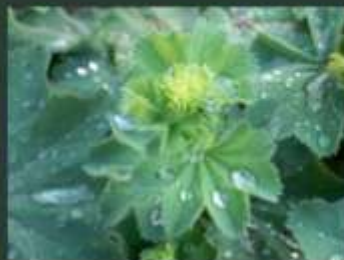
alchemilla mollis cornus canadensis