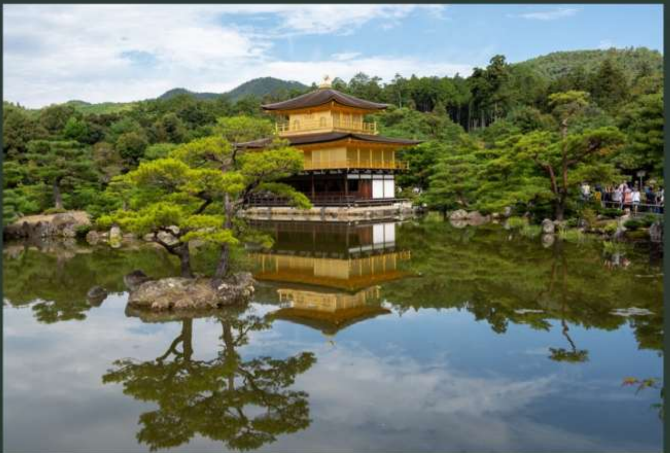
Tuin bij Gouden paviljoen in Kyoto